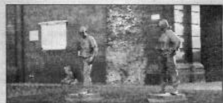
IMMAGINI DA "TRA-GHETTO" E "ALLEGRA PELLAGRA" IN FONDO A DESTA PORTA L'ARTE

MERCOLEDÌ 27 GIUGNO 2007 n. 175 il Domani